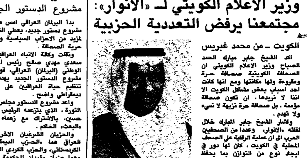
الشيخ جابر مبارك الحمد الصباح

الرغبة ولكن ما تحذفه الرقبة عننا شيء بسيط ولا ينكر، ولا تخفيك اني انا لا نزيدنا، ان تكون صحفة مؤمنة، بل صحفة حرة نزيهة لا تهمد ولا تهدم. واشرف الشيخ جابر المبارك خلال لقائه «الانوار»، وعدا من الصحفيين العرب الى ان عملية الرقبة على الصحف المحلية في الكويت، كان لها دور في ايجاد نوع من التوازن بما يحفظ الجبهة الداخلية، واصفها: لو لم تتخذ مثل هذا القرار لكنت كل صحفة خلال كاتب يستمرس في الكتابة في هواء وفي رزمة من البلد والتعرض لتماثلت الجبهة الصادرة عن وزارة الاعلام، وقد اصبح فيما بعد قرارا سياسيا لان مثل هذا الامر يمس امن الوطن، وربما كان اسم الرقبة، او وجودها شيء يدعو الى